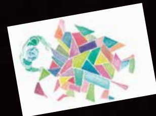
ユキ・アリマサC D「Dimensions」 Artwork Chiemi Yoshida

*ご参考 新幹線時刻表(2023年11月現在)東京駅12:04→軽井沢駅13:20、東京駅11:04→軽井沢駅12:15、東京駅10:32→軽井沢駅11:36